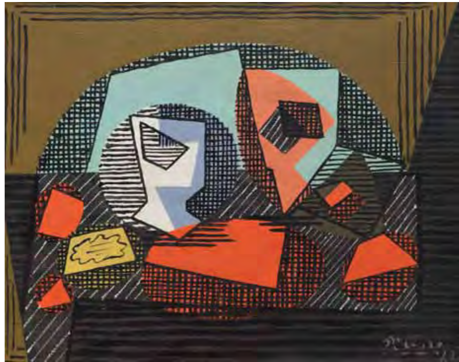
PABLO RUIZ PICASSO (Málaga, 1881 - Mougins, Francia, 1973) Paquet de tabac et verre , 1922 Óleo sobre lienzo, 33,5 x 41,5 cm